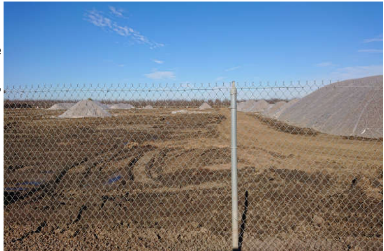
Stockpiles Mandeln 2018

Viele Huller Sheller sagten allerdings auch, dass man Mitte Dezember mit der Bearbeitung fertig wäre. Allerdings stellt sich dann die Frage wann die Packer die dann vorhandenen Bestände durchsortiert haben und genauer wissen, was in welcher Größe und Qualität vorhanden ist. Generell scheint Einigkeit darüber zu herrschen, das die Qualität, insbesondere was „Insect Dammage“ angeht besser als im Vorjahr zu sein scheint. Bei den Nonpareil finden sich wegen der etwas geringeren Erträge gute Größen. Ebenso bei den Carmel, allerdings mit der Tendenz zu vielen Doubles. California scheinen kaum 27/30er, dafür mehr Grössern darüber und Butte/Padre eher sehr kleinfallend mit praktisch kaum 27/30 aber kleinen Größen bis 40/50.